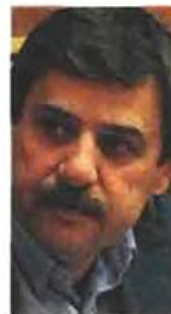
ΑΝΑΠΛΗΡΩΤΗΣ ΥΠΟΥΡΓΟΣ Ανδρέας Ξάνθος

Έχει γεννηθεί το 1951 στο Ματσούκι Αιτωλοακαρνανίας. Σε ηλικία 10 ετών έχασε το φως του από έκρηξη γερμανικής χειροβομβίδας, απομεινάρια του πολέμου. Αυτό δεν τον εμπόδισε να σπουδάσει στη Νομική Αθηνών.