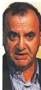
ΑΝΑΠΛΗΡΩΤΗΣ ΥΠΟΥΡΓΟΣ Δημήτρης Στρατούλης

Ο ΑΝΔΡΕΑΣ Ξάνθος είναι μικροβιολόγος. Έχει διατελέσει πρόεδρος της Ένωσης Γιατρών ΕΣΥ Ρεθύμνου και βουλευτής από το 2012. Τάσσεται υπέρ της ενίσχυσης του ΕΟΦ, ώστε να μπορεί να παρεμβαίνει ουσιαστικά στην αγορά φαρμάκου.