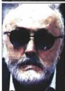
Σήμα κινδύνου εκπέμπουν οι εκπρόσωποι των κλινικών με επιστολή τους στον υπουργό Υγείας Παναγιώτη Κουρουμπλή

μάς επιβάλλει υψηλότατα πρόστιμα για καθυστερήσεις στη μισθοδοσία και μας σύρει στα δικαστήρια για διάπραξη ποινικών αδικημάτων. Ποιους; Εμάς, που το κράτος μάς οφείλει πολλαπλάσια ποσά, τα οποία, εάν είχαμε εισπράξει, δεν θα υπήρχε κανένα πρόβλημα» εξηγούν. Η ΠΕΙΚ εκμύησε ότι πο-