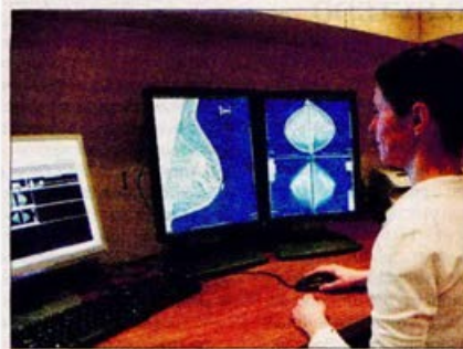
Απεικόνιση ψηφιακής μαστογραφίας σε υπολογιστή

Ειδικότερα, καταργείται το εδάφιο 22 του άρθρου 3 της υπουργικής απόφασης (οικ. 70521/2014), που είχε ληφθεί από την προηγούμενη ηγεσία του υπουργείου Υγείας. Αξίζει να σημειωθεί ότι όλο αυτό το διάστημα ο ΕΟΠΥΥ δέχεται σωρεία καταγγελιών και παραπόνων από τους ασφαλισμένους για το «χαράτσι» στις διαγνωστικές εξετάσεις, όπως αναφέρει στην ανακοίνωσή του το υπουργείο Υγείας. Συγκεκριμένα, οι ιδιώτες πάροχοι υγείας απαιτούσαν την επιπρόσθετη οικονομική επιβάρυνση, χωρίς να καθορίζεται από καμία κανονιστική πράξη το ύψος της ανά είδος εξέτασης υψηλής καινοτομίας. Αυτό είχε αποτέλεσμα πολλοί δικαιούχοι του ΕΟΠΥΥ να καταβάλλουν συμμετοχή που υπερέβαινε την αποζημίωση της εξέτασης με βάση το κρατικό τιμολόγιο.