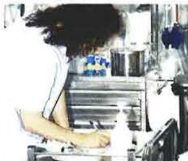
Για όλη τη Βόρεια Ελλάδα λειτουργεί μόλις μια μονάδα εντατικής νοσηλείας παιδιών στη Θεσσαλονίκη, στο Ιπποκράτειο Νοσοκομείο

Η ΜΕΘ έξι κλινών της Πτολεμαΐδας είναι η μοναδική στη Δυτική Μακεδονία, αφού επί χρόνια η ΜΕΘ του Μαμάτσειου νοσοκομείου Κοζάνης παραμένει στα χαρτιά και τα επτά κρεβάτια της είναι κλειστά εξαιτίας της έλλειψης προσωπικού. Λουκέτο έχει μπει εδώ και χρόνια και στη ΜΕΘ του νοσοκομείου Καστοριάς που είχε έξι κρεβάτια.