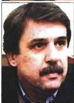
Αριστερά: Ο αναπληρωτής υπουργός Υγείας Ανδρέας Ξανθός

νελλήνια Ομοσπονδία Εργαζομένων Δημοσίων Νοσοκομείων (ΠΟΕΔΗΝ), σε μια σκληρή ανακοίνωση, αναφέρει ότι «την ώρα που τα Κέντρα Υγείας στενάζουν από τις δραματικές ελλείψεις σε προσωπικό και στοιχειώδες υγειονομικό υλικό, όπως γάντια, σύριγγες, φάρμακα και βενζίνη για τα ασθενοφόρα, το υπουργείο Υγείας ανακοινώνει μεγαλεπήβολα σχέδια, όταν δεν έχει χρήματα για τις εφημερίες»!