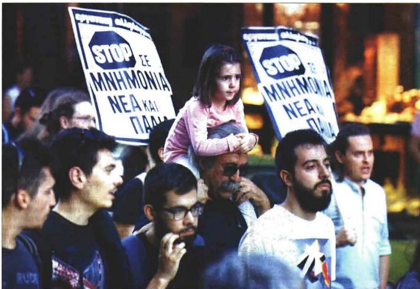
Φωτογραφία αρχείον από διαδήλωση κατά της άγριας λιτότητας

Στο ίδιο μήκος κύματος, η Πανελλήνια Ομοσπονδία Εργαζομένων στα Δημόσια Νοσοκομεία (ΠΟΕΔΗΝ) προβλέπει «νέες μειώσεις μισθών, νέες διαθεσιμότητες και απολύσεις», ενώ ο Πανελλήνιος Φαρμακευτικός Σύλλογος (ΠΦΣ) βάζει λουκέτο για 24 ώρες σε 11.000 φαρμακεία, αντιδρώντας στις ρυθμίσεις για τα μη συνταγογραφούμενα φάρμακα (ΜΗΣΥΦΑ) και προειδοποιεί με απεργία διαρκείας.