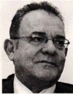
Ο πρόεδρος του ΕΟΠΥΥ Δημήτρης Κοντός πρέπει να κληθεί άμεσα να δώσει εξηγήσεις για το θέμα με το οποίο χারίστηκαν εκατομμύρια ευρώ σε κλινικά κάρτες.