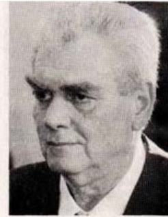
Ο νέος υπουργός για τη Διασφορά Δημήτρης Παπαγγελόπουλος πρέπει να παρέμβει άμεσα και να διερευνήσει τη σκανδαλώδη αυτή υπόθεση.

δυνατοίτητά της δεδομένου ότι έχουν εντοπισθεί περιπτώσεις χρεώσεων για συγκεκριμένες υποτιθέμενες ιατρικές υπηρεσίες που παρασκήθηκαν ενώ η κλινική δεν είχε την αντίστοιχη ιατρική ειδικότητα!