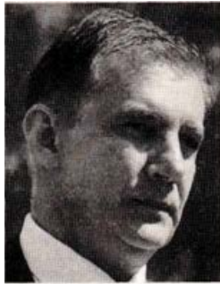
Με απόφαση του υπεργραμματέα υπουργού Υγείας, Θόδωρο Δημόπουλο δύο μέρες πριν παρατηρήσει τη γλιτώνουν λαμόγια κλινικά κάρτες που κατέκλεψαν τον ΕΟΠΥΥ.