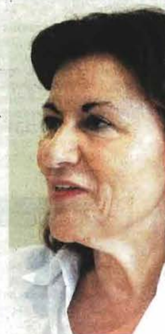
Η αναπληρώτρια υπουργός Εργασίας, Θεανώ Φωτίου.

Ο ικονομική στήριξη σε 350.000 πολίτες, που αντιμετωπίζουν προβλήματα διαβίωσης εξαιτίας της παρατεταμένης οικονομικής κρίσης, θα φέρει η επέκταση του ελάχιστου εγγυημένου εισοδήματος σε όλη τη χώρα, η οποία προωθείται από το υπουργείο Εργασίας, Κοινωνικής Ασφάλισης και Αλληλεγγύης και πιο συγκεκριμένα από την αναπληρώτρια υπουργό, Θεανώ Φωτίου . Σύμφωνα με στελέχη του υπουργείου, η πλήρης εφαρμογή του προγράμματος, του οποίου ο προϋπολογισμός θα αγγίξει τα 500 εκατ. ευρώ, θα ενισχύσει οικονομικά 350.000 δικαιούχους από τον Απρίλιο του 2016.