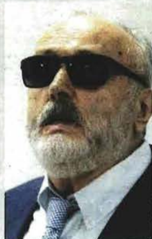
Ο υπουργός Εσωτερικών, Παναγιώτης Κουρουμπλής.

Μ ηνιαίο επίδομα 44 ευρώ σε ανήλικα παιδιά, που στερούνται της πατρικής προστασίας, μέχρι συμπλήρωσης του 16ου έτους της ηλικίας τους, προωθείται άμεσα από τους φορείς της τοπικής αυτοδιοίκησης σε συνεργασία με το υπουργείο Εσωτερικών και τον επικεφαλής του, Παναγιώτη Κουρουμπλή . Το μηνιαίο επίδομα χορηγείται σε παιδιά έως 16 ετών εφόσον στερούνται πατρικής φροντίδας και προστασίας λόγω: θανάτου, αναπηρίας 67% και άνω, εγκατάλειψης, φυλάκισης άνω των τριών μηνών, στράτευσης, αλλά και τέκνα εκτός γάμου. Τα εισοδηματικά κριτήρια αποτελούν τη βάση για