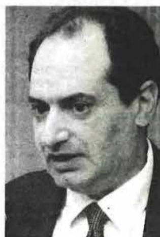
Ο υπουργός Υποδομών, Μεταφορών και Δικτύων, Χρήστος Σπίρτζης.

Στην έκδοση κάρτας απεριορίστων διαδρομών για άνεργους προχωράει άμεσα το υπουργείο Μεταφορών, στο πλαίσιο της στήριξης των ανέργων και των ευπαθών κοινωνικών ομάδων. Ο υπουργός Υποδομών, Μεταφορών και Δικτύων, Χρήστος Σπίρτζης, υπογράμμισε σε πρόσφατη συνέντευξη του ότι, ήδη, οι άνεργοι μπορούν με την επίδειξη της κάρτας ανεργίας και της αστυνομικής τους ταυτότητας να χρησιμοποιούν τα Μέσα δωρεάν ενώ και ο Αλέξης Τσίπρας, κατά τις προγραμματικές δηλώσεις στη Βουλή, εξήγησε πως -στο πλαίσιο της κοινωνικής πολιτικής της κυβέρνησης- θα εκδοθούν (δωρεάν) κάρτες μετακίνησης για ΑμεΑ, πολύτεκνους, τρίτεκνους, άνεργους και