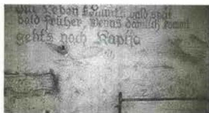
Η πόρτα του καταφυγίου, κατασκευασμένη από σουηδικό ξύλο, και συνθήματα γραμμένα στα γερμανικά. Δεξιά υπόγειος διάδρομος.