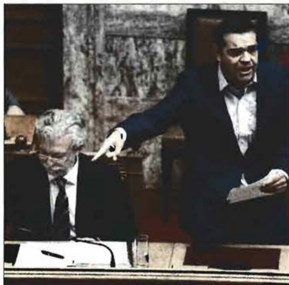
Ο Αλ. Τσίπρας με τον υπουργό Δικαιοσύνης Στ. Κοντονή

και θλιψη κράτους δικαίου, με αφορμή την υπόθεση Novartis, εξαπέλυσε ανώτατη πηγή της Ν.Δ. «Η ποινικοποίηση της πολιτικής ζωής είναι δεδομένη, τώρα όμως έχουμε και "πολωνοποίηση". Είναι ένα πρόβλημα που αντιμετωπίζει η Ευρώπη, όταν δεν έχουμε διάκριση των εξουσιών, δεν έχουμε κράτος δικαίου» σχολίασε η ίδια πηγή. «Οι αναφορές σε "πολωνοποίηση", σχέδια εξόντωσης, σκευωρίες και "κουκουλοφόρους" μάρτυρες μοναδικό στόχο έχουν τον εκφοβισμό της Δικαιοσύνης και των θεσμών. Το μόνο, όμως, που καταφέρνουν είναι να επιβεβαιώνουν τον πανικό τους και να αυτοεξευτελιζονται» ήταν η απάντηση του Μεγάρου Μαξίμου.