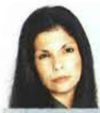
ΣΥΝΕΝΤΕΥΞΗ ΣΤΗ ΜΑΡΘΑ ΚΑΪΤΑΝΙΔΗ

Κατάματα κοιτάει ο υπουργός Υγείας, Βασίλης Κικίλιας, την γκριζα εικόνα του δημόσιου συστήματος Υγείας. Στη συνέντευξή του στα «NEA» αναλύει τα προβλήματα, χωρίς υπεκφυγές, και ξεδιπλώνει την επόμενη σελίδα. Προτεραιότητα είναι (και) η αναδιάρθρωση της πολύπαθης Πρωτοβάθμιας Φροντίδας Υγείας, που προβλέπει ακόμη και ομογενοποίηση των Κέντρων Υγείας με τις ΤΟΜΥ, ενώ υπό εξέταση είναι το ενδεχόμενο του υποχρεωτικού εμβολιασμού στους μαθητές.